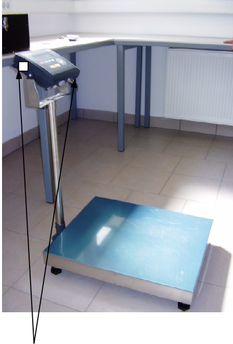
Zaštitni žig u obliku naljepnice za kućište i spojni kabl MPS