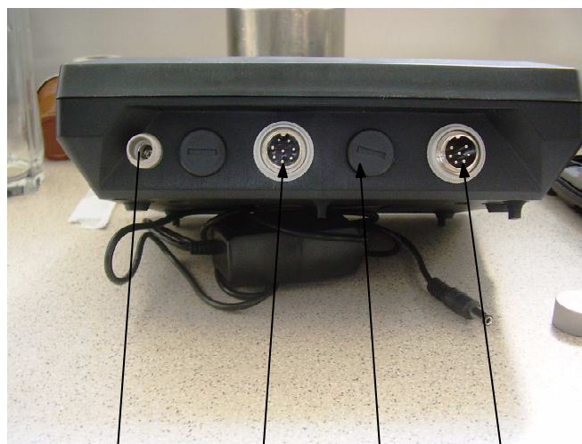
AC/DC RS 232 Vaga2 Vaga1